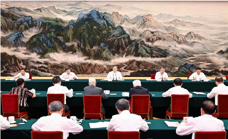
全国优秀教师代表座谈会